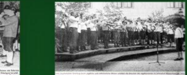
Erstmals war in der Pfarrei St. Peter und Paul in Biberbach am Isar eine St. Hubertus-Messe im Isar. Der musikalische Teil besteht aus der Pfarrei St. Peter und Paul in Biberbach am Isar.