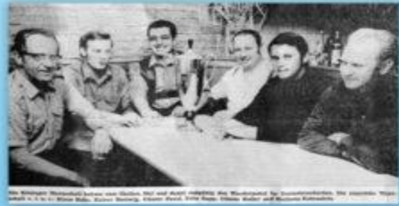
Ein Mitglied der Kreisgruppe Kitzingen bei der Teilnahme an einem Schießwettbewerb.