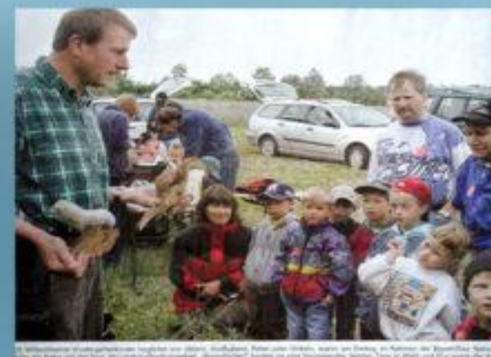
Die Kinder sind mit den Bienen und den Bienen. Die Kinder sind über die Woche mit der Bienen und den Bienen.