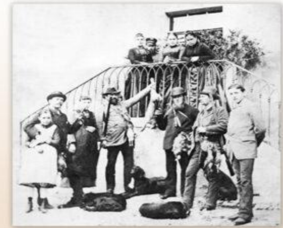
© Revier-Übernahme 1902 1. Treibjagd 1904 Revier Gerlachshausen - Sommerach Strecke: 358 Hasen 6 Fasanen.