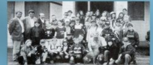
Die Kinder sind mit den Bienen und den Bienen. Die Kinder sind über die Woche mit der Bienen und den Bienen.