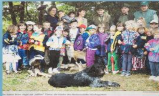
Die Kinder sind mit den Bienen und den Bienen. Die Kinder sind über die Woche mit der Bienen und den Bienen.