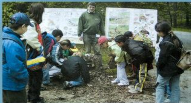
Die Kinder sind mit den Bienen und den Bienen. Die Kinder sind über die Woche mit der Bienen und den Bienen.