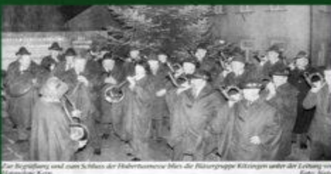
Zur Begrüßung sind nach Schluß der Hubertusmesse die Bläsergruppe Kitzingen unter der Leitung von...