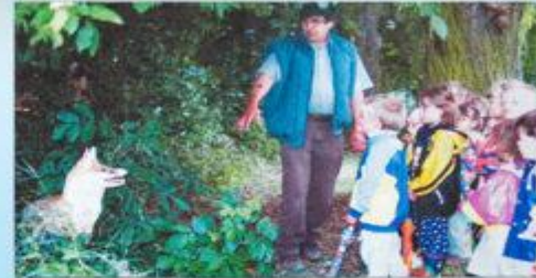
Die Lebensgewohnheiten der heimischen Tierwelt lernten die Kindergartner Kinder aus Pilsenerstadt kennen. Unter dem Motto „Lernort-Natur-Tag“ hatte der Bayerische Jagdverband eine Informationsveranstaltung auf dem Grillplatz durchgeführt. Lesen Sie dazu auch den Artikel auf Seite 14.