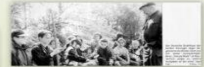
Text describing the activity, likely related to the nature walk or the children's participation in the event.