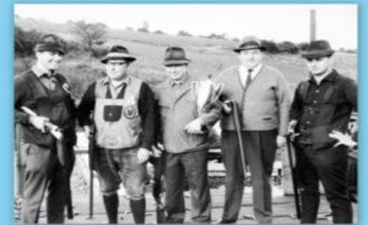
Ein Mitglied der Kreisgruppe Kitzingen bei der Teilnahme an einem Schießwettbewerb.