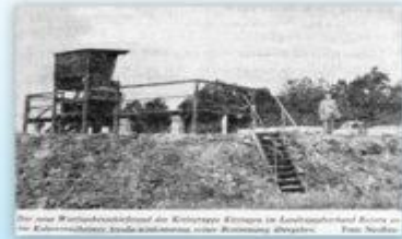
Der neue Wurstaubstand der Kreisgruppe Kitzingen im Landesverband Bayern ist im Kalmerschießplatz, Kalmerschießplatz, Kalmerschießplatz.