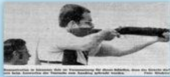
Ein Mitglied der Kreisgruppe Kitzingen bei der Teilnahme an einem Schießwettbewerb.