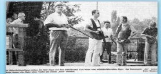
Ein Mitglied der Kreisgruppe Kitzingen bei der Teilnahme an einem Schießwettbewerb.