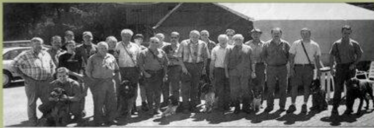
Hund und Herrchen können zufrieden sein: Alle 22 Vierbeiner des Hundekurses für Gebrauchs- und Jagdhunde, die der Kreisverband Klubschaff im Bayerischen Landesjagdverband auch heuer wieder auf dem Gelände des Kleintierzüchtersvereins Großlangheim veranstaltete, haben mit teilweise hervorragenden Ergebnissen bestanden.