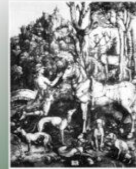
St. Hubertus - Messe