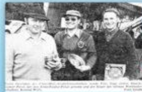
Ein Mitglied der Kreisgruppe Kitzingen bei der Teilnahme an einem Schießwettbewerb.