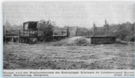
Mittig wird der Wurstaubstand der Kreisgruppe Kitzingen im Landesverband Bayern seiner Bestimmung übergeben.