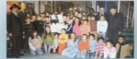
Die Kinder sind mit den Bienen und den Bienen. Die Kinder sind über die Woche mit der Bienen und den Bienen.