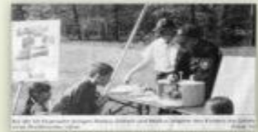
Text describing the activity, likely related to the nature walk or the children's participation in the event.