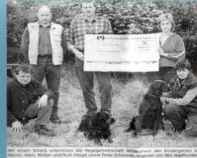
Die Kinder sind mit den Bienen und den Bienen. Die Kinder sind über die Woche mit der Bienen und den Bienen.