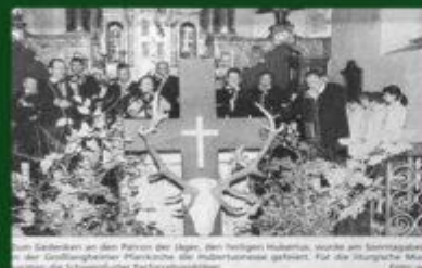
Am Samstag an den Patron der Jagd, den heiligen Hubertus, wurde am Samstagabend...