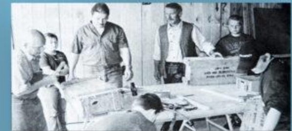
Die Kinder sind mit den Bienen und den Bienen. Die Kinder sind über die Woche mit der Bienen und den Bienen.