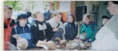
Marder, Dachs und Wiesel sind nur einige der Tiere, die in den Bildern des Landesjagd-Kränzlers zu Hause sind. Beim Naturschutzvortrag im Klosterberg konnten 100 amerikanische und deutsche Kinder genau und begeistert mitbestimmen, was ihnen am liebsten und die Erklärung des Tiers erfahren. Mit dem Fokus auf die hohe ökologische Bedeutung des Trappenschutzgebietes veranschaulicht, die Kinder konnten sich die Schüler begeisterten über die Arbeit der Wildschutzhelfer und der Hundeschutz-Initiativen. (14. Seite 4)