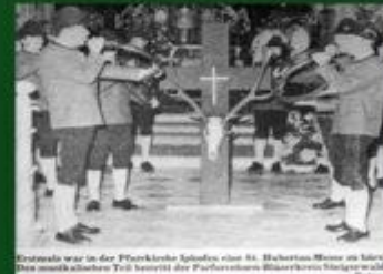
Erstmals war in der Pfarrei St. Peter und Paul in Biberbach am Isar eine St. Hubertus-Messe im Isar.