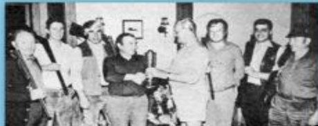
Ein Mitglied der Kreisgruppe Kitzingen bei der Teilnahme an einem Schießwettbewerb.