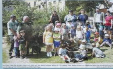
Die Kinder sind mit den Bienen und den Bienen. Die Kinder sind über die Woche mit der Bienen und den Bienen.