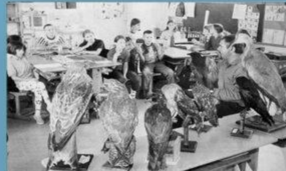
Die Kinder sind mit den Bienen und den Bienen. Die Kinder sind über die Woche mit der Bienen und den Bienen.