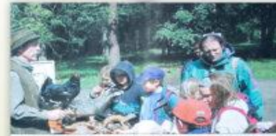
Wo kommt eigentlich das Birkenholz her, und was ist es am liebsten?