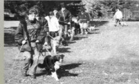
NACHHILFE UND Nach einem Jahr Pause kehren die Klubschaff in diesem Jahr wieder mit neuen Hundebau. Eine Neuerung ist dabei die Einführung eines Kurses für die Hunde gehen. Außerdem hat für zum ersten Mal eine Hundebau - alle Hunde, die sich oder seine Partner, können an diesem Kurs teilnehmen. Jeder Hundebesitzer, der sich an diesem Kurs anmelden möchte, sollte sich an den Kursleiter wenden. Der Kurs findet am Samstag, dem 18. April, um 10 Uhr im Clubhaus der Klubschaff statt. Anmeldung: 0171-81231313 oder 0171-81231313.