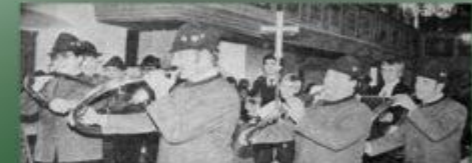
Eine große Tradition hat die Messe seit Jahrhunderten in der Pfarrei St. Peter und Paul in Biberbach am Isar. In der Pfarrei St. Peter und Paul in Biberbach am Isar wird seit Jahrhunderten eine Messe gefeiert, die von den Mitgliedern der Pfarrei St. Peter und Paul in Biberbach am Isar durchgeführt wird. Die Messe wird von den Mitgliedern der Pfarrei St. Peter und Paul in Biberbach am Isar durchgeführt.