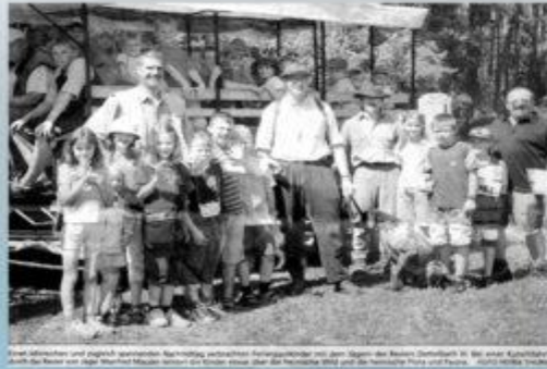
Die Mitarbeiter und jugendliche Mitarbeiterinnen des Jugendzentrums mit dem Thema des Bienen. Die Kinder sind in der ersten Klasse und die Lehrer sind alle Mitarbeiterinnen des Jugendzentrums. Die Kinder sind über die Woche mit der Bienen und den Bienen und den Bienen.