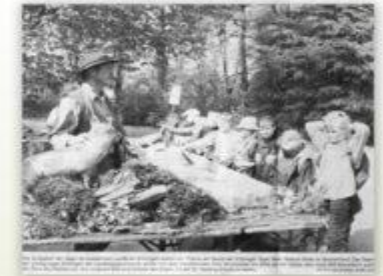
Text describing the activity, likely related to the nature walk or the children's participation in the event.