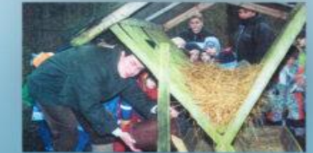
Die Kinder sind mit den Bienen und den Bienen. Die Kinder sind über die Woche mit der Bienen und den Bienen.